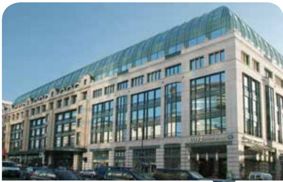
Les bureaux de l'APL occupent une partie du City Center situé Boulevard du Jardin Botanique.

Au 1 er janvier 2012, l'APL regroupait 99 agents actifs 3 . Outre les services de support centraux de la Direction générale (secrétariat, indicateur, budget, staff, informatique, relations internationales, communication et gestion de la documentation), l'APL est divisée en deux grandes branches :