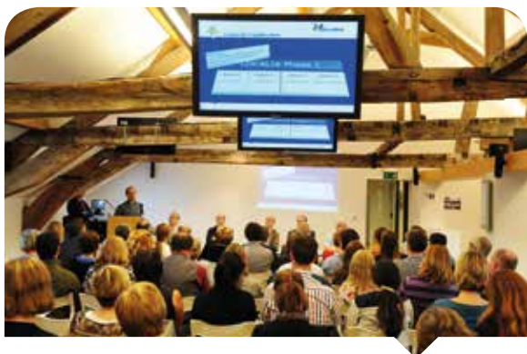
Présentation de Localia aux communes, au BIP, Place Royale.

A l'heure de la simplification administrative et du développement durable, l'Administration des Pouvoirs locaux a entrepris de moderniser son outil informatique en vue d'atteindre ces objectifs. A terme, tous les documents reçus et générés par l'APL existeront sous format informatique. Pour la plupart, le format papier n'aura même jamais existé. Ils seront accessibles à distance au moyen d'une application web développée spécifiquement à cet effet : la plateforme TxChange.