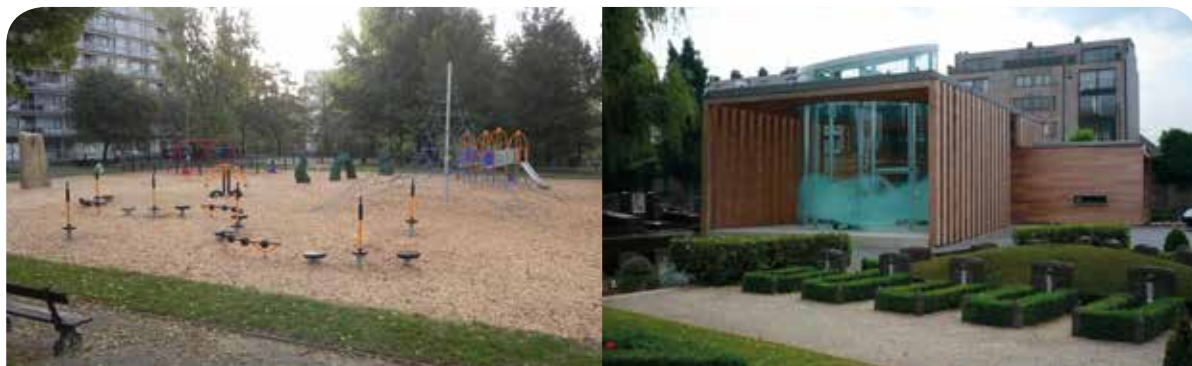
Rénovation de l'aire publique de jeux au Parc Peterbos à Anderlecht. Rénovation du bâtiment du cimetière de Jette en bâtiment exemplaire.

En outre, les montants non utilisés de la DTI du triennat 2007-2009, soit 1 million d'euros, sont reportés au triennat 2010-2012 pour être utilisés pour des travaux d'utilisation rationnelle de l'énergie dans les bâtiments.