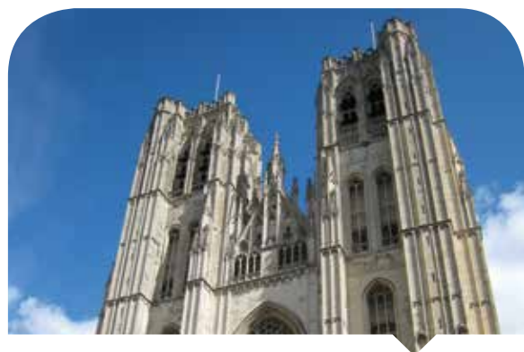
La cathédrale des Saints-Michel-et-Gudule.

La législation en matière d'organisation et de contrôle des communautés culturelles reconnues a été régionalisée au 1 er janvier 2002. Certaines des communautés couvraient une circonscription géographique qui s'étend au-delà des frontières régionales. L'exercice de cette tutelle réclame donc impérativement un accord de coopération entre les Régions. Le problème est particulièrement crucial en ce qui concerne l'archevêché de Malines-Bruxelles qui s'étend, outre notre Région, sur trois provinces. Les deux fabriques catholiques cathédrales comprises dans cette circonscription, Saints-Michel-et-Gudule à Bruxelles et Saint-Rombaut à Malines, concernent a priori les trois Régions. En 2012, aucun accord de coopération n'a encore été signé.