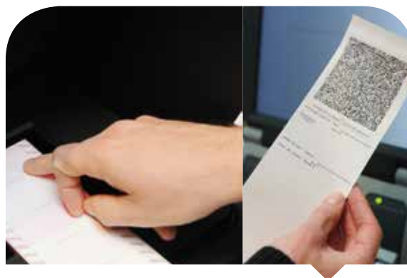
Le ticket imprimé par le système Smartmatic

En ce qui concerne le système Smartmatic, aucune demande d'intervention majeure n'a été enregistrée par l'APL. Le rapport du collège des experts mandaté a relevé cependant des maladies de jeunesse liées à ce nouveau système tout en soulignant ses grandes potentialités.