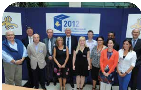
Le Ministre-Président entouré d'une partie de l'équipe de l'APL qui a organisé les élections

Ce travail de tous les jours et pour beaucoup, de plusieurs soirées et de quelques nuits, sans compter les week-ends, a abouti au succès escompté.