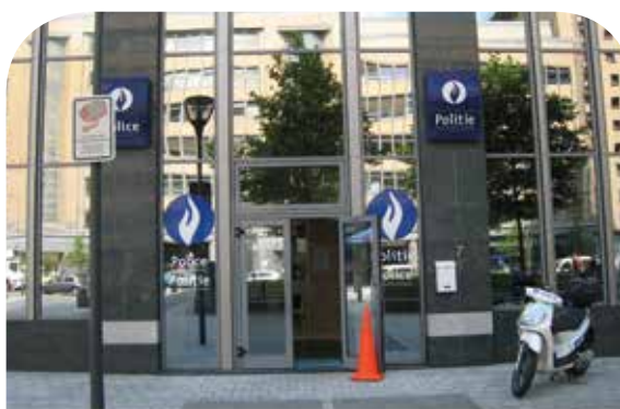
Poste de proximité de la Zone de Police Bruxelles-Midi.