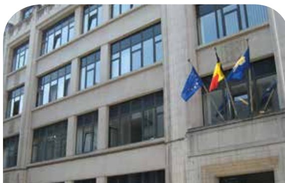
Siège de l'ERAP, rue Capitaine Crespel à Ixelles

Enfin, une subvention de 114 000 euros octroyée à l'ASBL « Solidarité » complète l'intervention régionale dans le domaine de l'accrochage scolaire. Pratiquement, cette association permet à des jeunes de participer à une année citoyenne, durant laquelle ils effectuent une série de prestations pour le compte d'associations partenaires, et suivent des formations à la citoyenneté menant, en fin de parcours, à la construction d'un projet dit de « post-solidarité ».