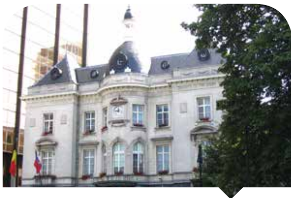
Maison communale de Saint-Josse-Ten-Noode.

Différentes directions de l'APL ont exprimé le besoin de modifier diverses dispositions de la nouvelle loi communale, soit en raison d'éléments externes (modification de lois, directives européennes, mise en œuvre du protocole d'accord entre les syndicats en vue de la modification de la Charte sociale, mise en œuvre de l'accord du Gouvernement), soit sur base d'initiatives internes (corrections techniques, question des délégations). Un groupe de travail a été mis sur pied afin de répertorier les éventuels articles à modifier, avec pour objectif de regrouper l'ensemble des textes modificatifs dans une ordonnance unique. La Direction des Affaires juridiques coordonne le travail de rédaction et veille au respect des aspects législatifs. En octobre 2012, une note récapitulative a été adressée au Ministre-président, contenant le