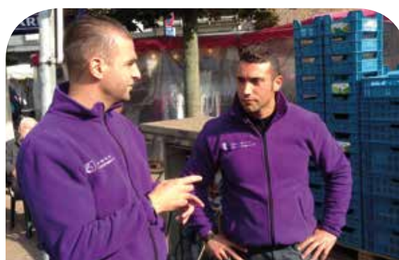
Gardiens de la paix sur le marché de Jette.

Citons par exemple l'Assetip (Mission locale d'Etterbeek), chargée d'une préformation « gardiens de la paix », l'ASBL « Objectif », dans le cadre d'actions de convivialité menées au niveau des transports en com-